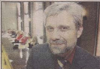
JOHNSEN: Ingen tegn til anger.

Nordli i Sørums er revet. Huset er borte, og taperen er først og fremst innbyggerne i Sørums. Det ukloke i beslutningen burde nå være gått opp for de ansvarlige, selv om Sørums ordfører viser alt annet enn anger i portrettintervjuet i RB for noen uker siden.